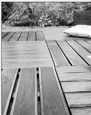
Фото из сети интернет