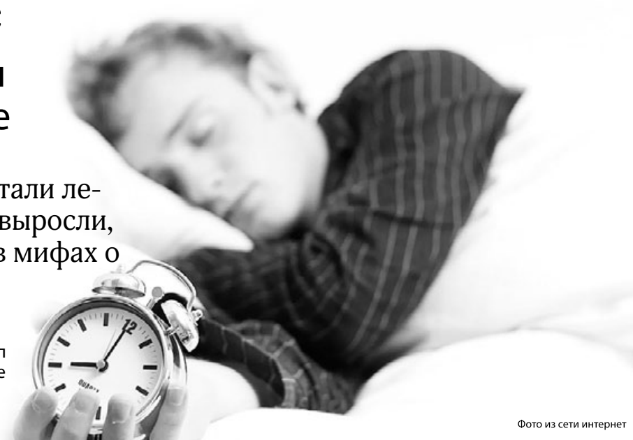
Фото из сети интернет