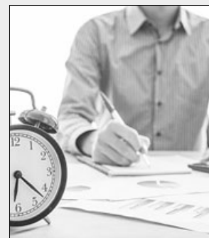
Фото из сети интернет